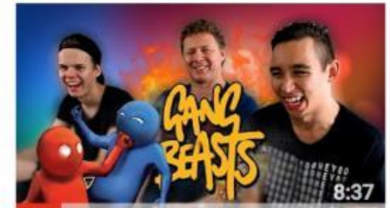
FAIJA HALUU TAAS PELAA | Gang Beasts