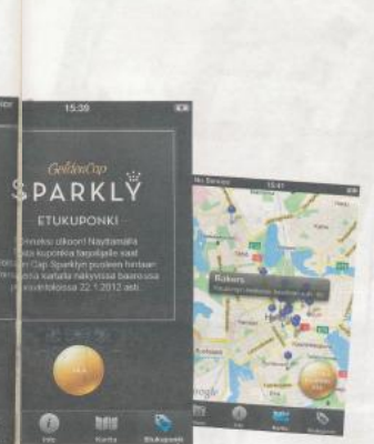
VIRTUAALIPULLOISTA PÖLÄTÄ. Appi Sparkly Shybyn Sparkly-sovellus laittaa käyttäjät Eken myymälään, jossa pullot, jotka on ladattu, näkyvät virtuaalisesti ja otetaan vastaan kahvipöydässä.

Alastalo arvostaa, että työntekijät voivat käyttää. "Tämä on työkalu, jota voidaan käyttää. Tämä on työkalu, jota voidaan käyttää."